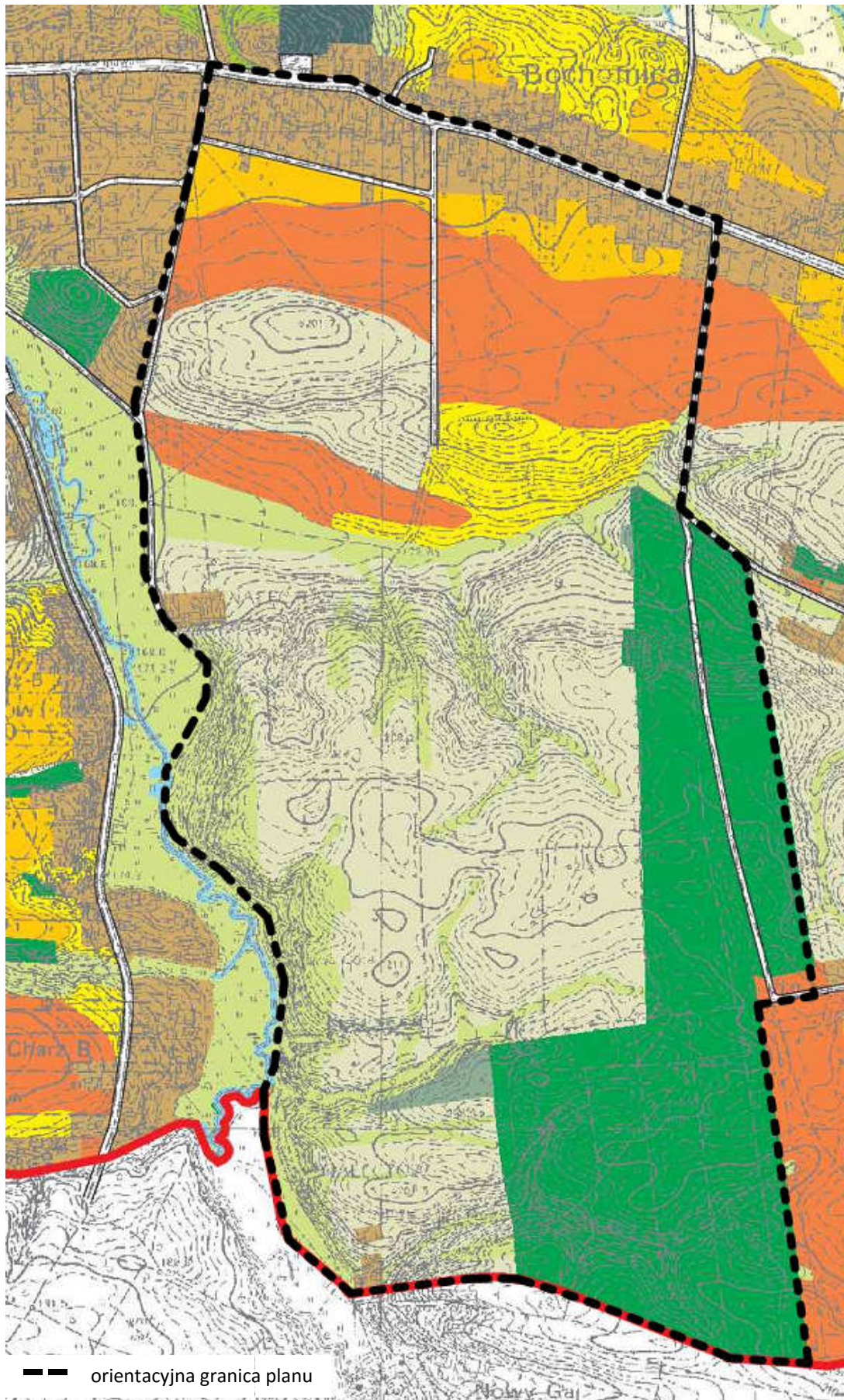
Rysunek 2 Wyrys z opracowania ekofizjograficznego podstawowego Gminy Nałęczów - ocena warunków ekofizjograficznych