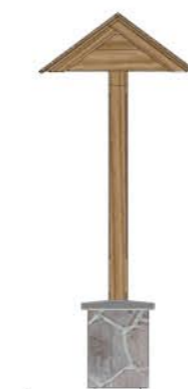
Element 3: 3M1, 3 pola, murek, 0 gablot skala 1:50