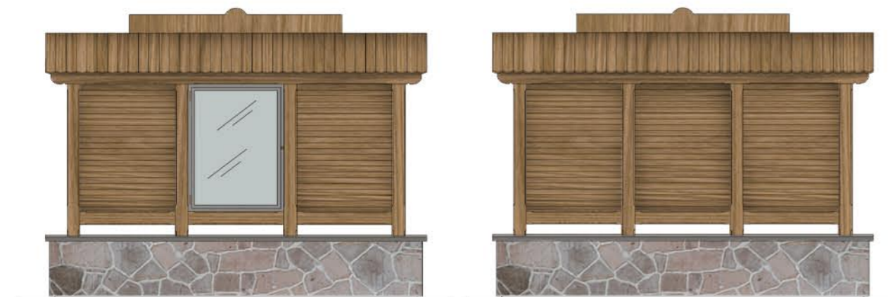
Element 2: 3M1, 3 pola, murek, 1 gablota skala 1:50