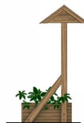
WIDOK Z BOKU, skala 1:50