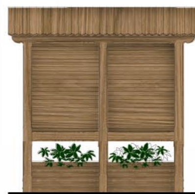
Element 3: 2D0, 2 pola, donice, 0 gablot skala 1:50