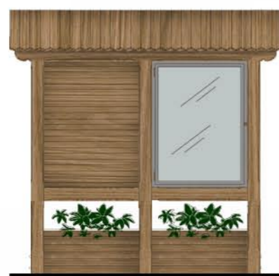
Element 2: 2D1, 2 pola, donice, 1 gablota skala 1:50