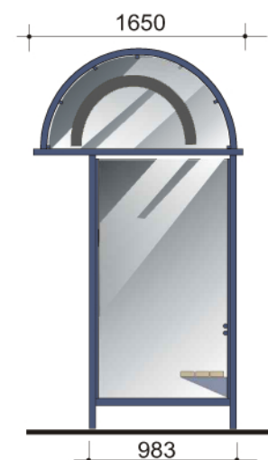
ścianka z cofniętym słupkiem