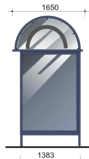
ścianka z gablotą