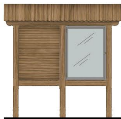
Element 2: 2S1, 2 pola, słupy, 1 gablota skala 1:50