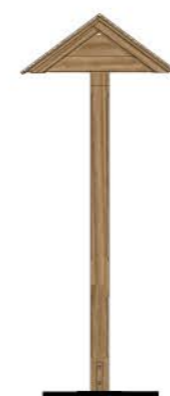
WIDOK Z BOKU, skala 1:50