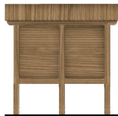
Element 3: 2S0, 3 pola, słupy, 0 gablot skala 1:50